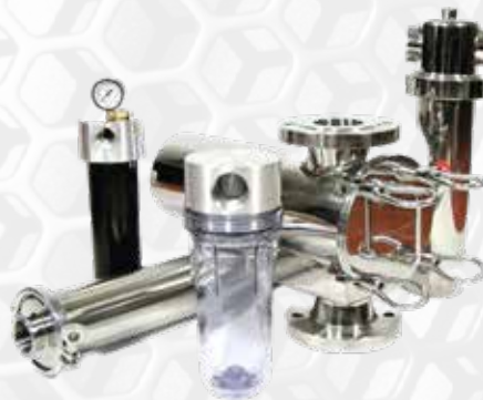
Filtros para FILTROS DE FLUJO COMPLETO