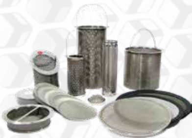
Filtros para CANASTA