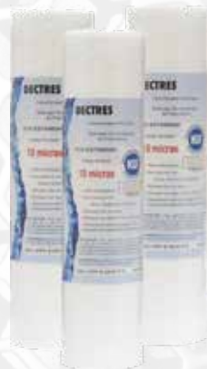
Filtros para AGUA