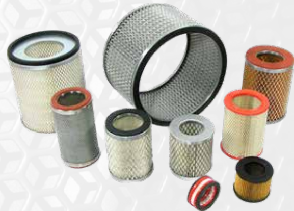
Filtros para AIRE