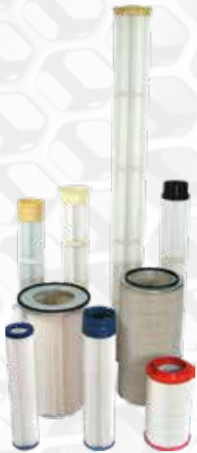
Colectores de POLVO